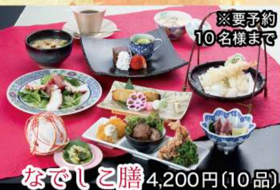
※要予約 10名様まで なでしこ膳 4,200円(10品)